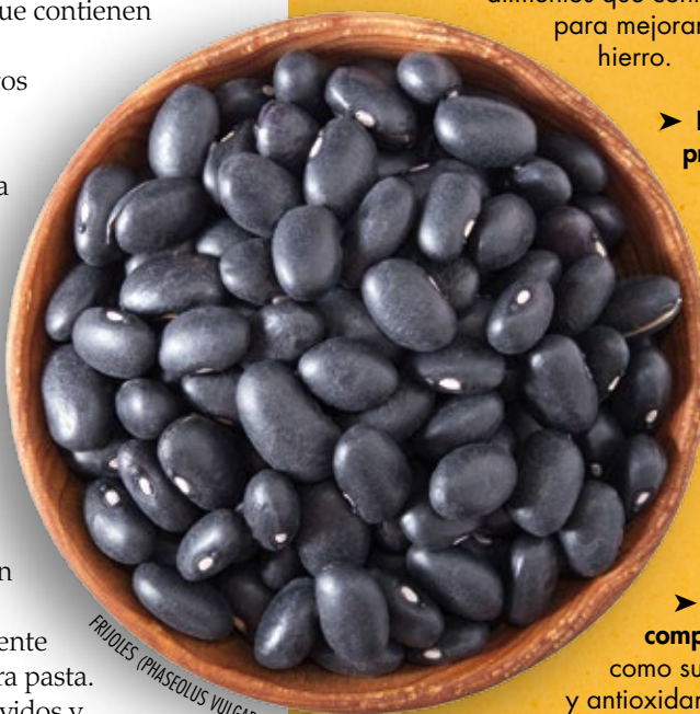
FRIJOL (PHASEOLUS VULGARIS)

Las legumbres se consumen de muchas maneras y en muchos tipos de comida según la cultura de cada país. En algunas regiones asiáticas, los garbanzos hervidos, los frijoles mungo y las habas de Lima son un alimento común para el desayuno o como tentempié. Se pueden añadir las legumbres - especialmente los frijoles- a sopas, ensaladas y salsas para pasta. En algunas partes de Italia, los frijoles hervidos y el atún constituyen un segundo plato habitual. Desde los seis meses de edad, las legumbres hervidas pueden agregarse a alimentos preparados para niños de corta edad, volviéndolos sabrosos y nutritivos.