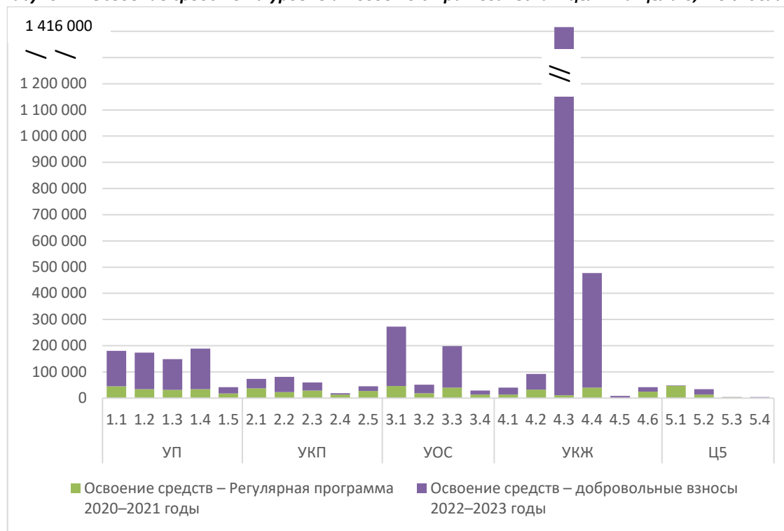
Рисунок 1. Освоение средств на уровне итогов по стратегическим целям и Цели 6, тыс. долл. США

13. Рисунок 2 иллюстрирует освоение внебюджетных ресурсов за двухгодичный период 2022–2023 годов в разбивке по типам расходов: проекты по ликвидации чрезвычайных ситуаций, проекты на местах, глобальные и региональные проекты. В двухгодичном периоде