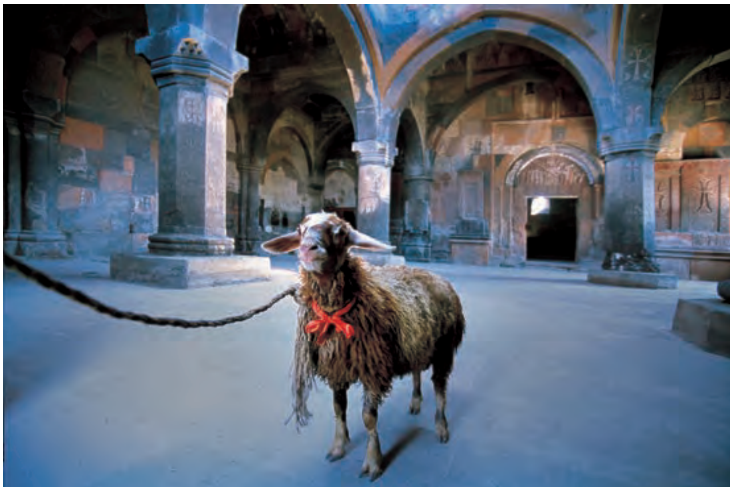
Овцы и козы являются неотъемлемой частью жизни и культуры Южного Кавказа