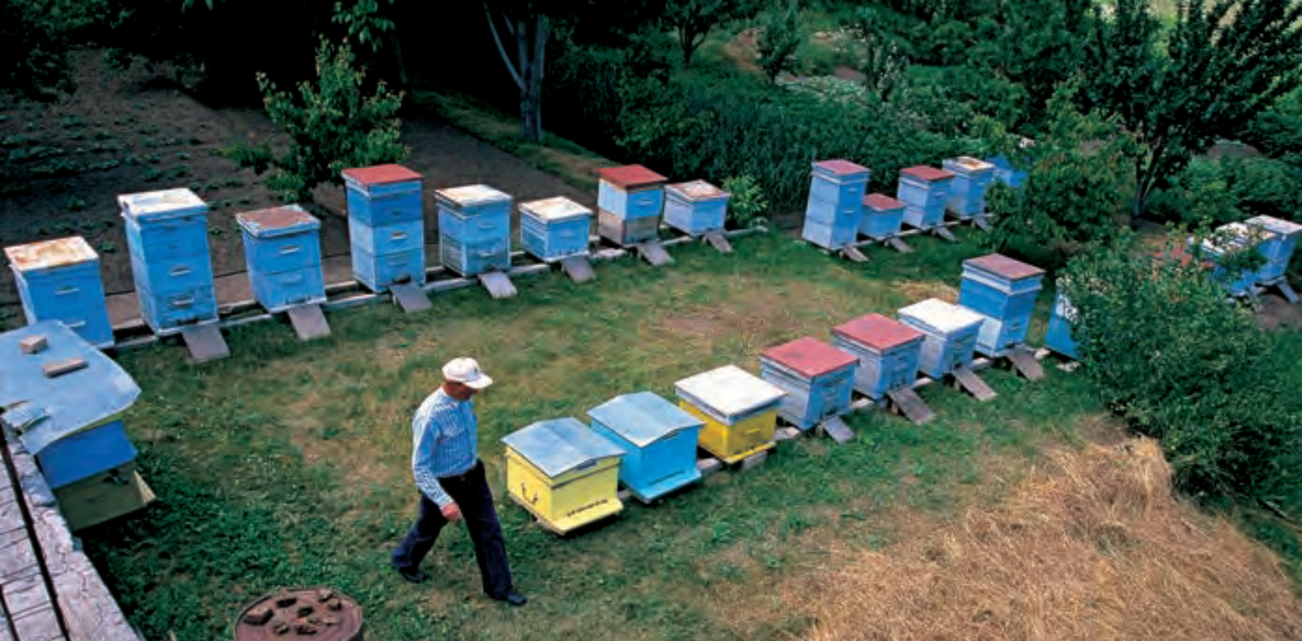
Ульи в селе Цагхадзор Котайкского марза. Опылители оказывают природную услугу, вносящую большой вклад в сельскохозяйственное производство, особенно в условиях изменения климата и цен на потребляемые факторы. <<Слева: Кавказская пчела на цветущем миндале