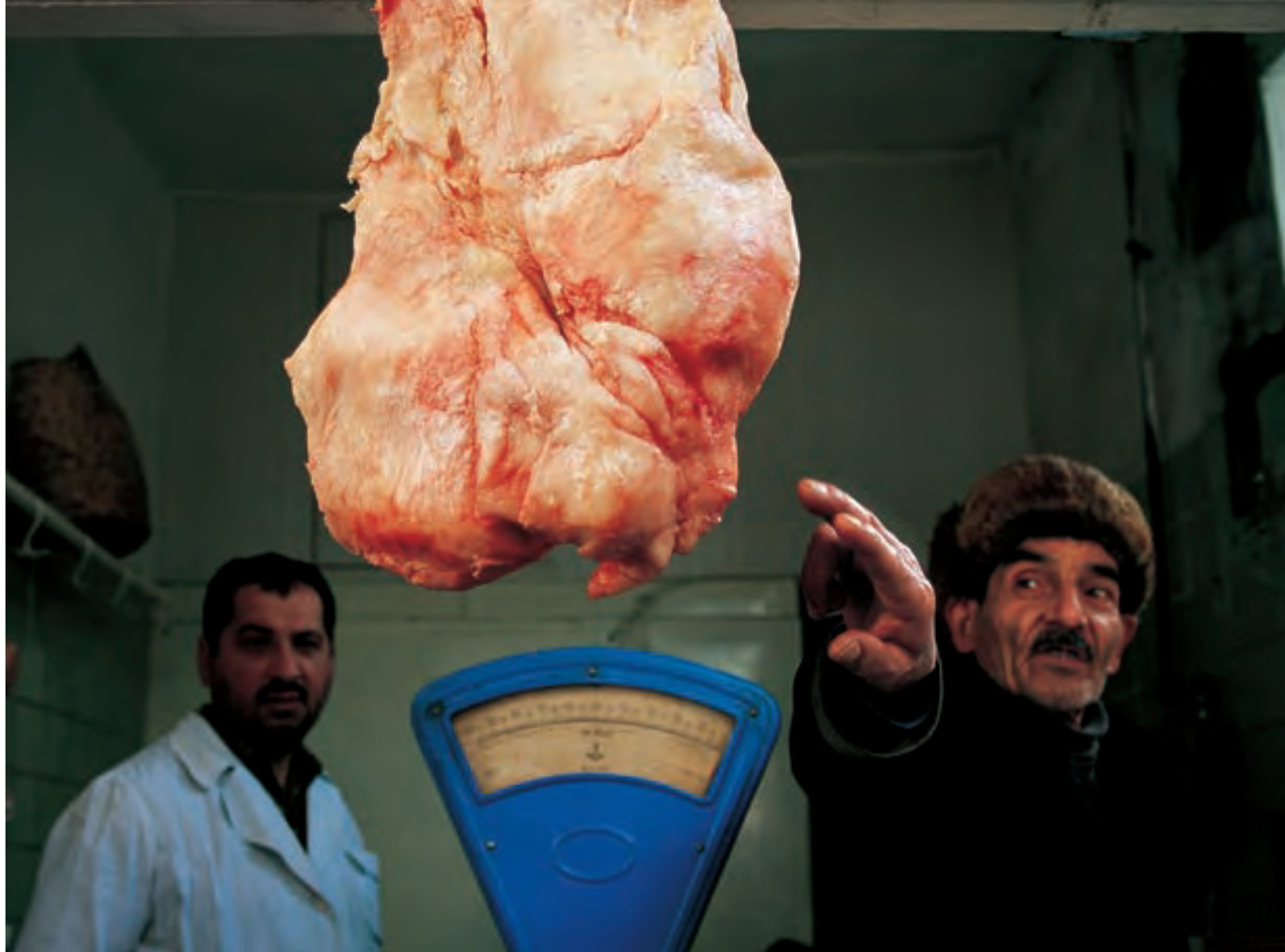
Мясник на базаре Тезе в Баку показывает впечатляющий характерный для курдючной овцы хвост. Внизу : летний выгон в горах Мавуш и Арагац. Наряду с армянами в Армении разведением овец занимаются езиды и курды; последние летом уходят на высокогорные пастбища, а зимой спускаются в свои селения