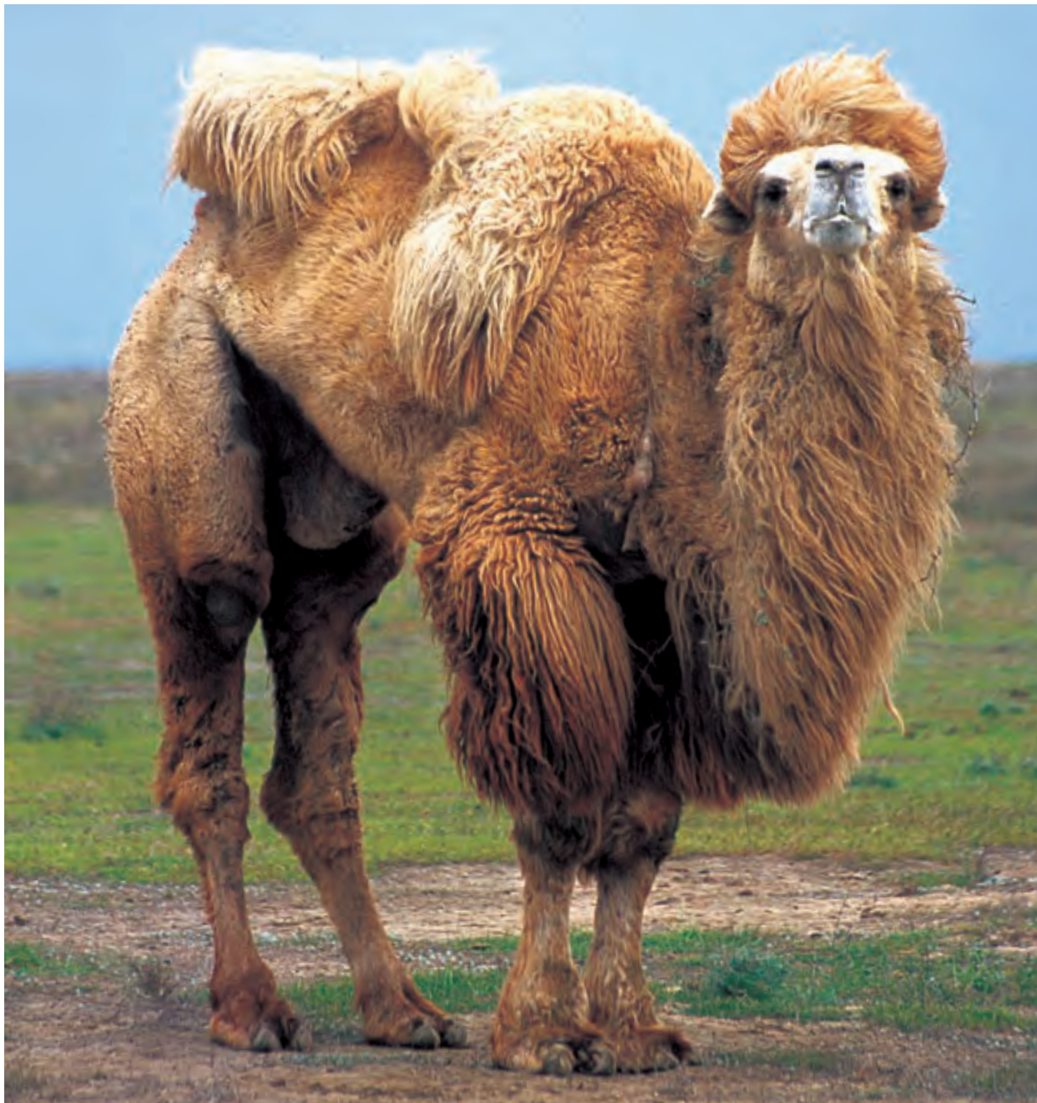
Верблюды могут весить до 900 кг и давать до 1700 литров молока за лактацию и 10 кг ценной шерсти. Этому самцу верблюда из Муганского района 50 лет, что является солидным возрастом для этих животных