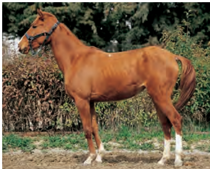
Лошади были одомашнены на Южном Кавказе очень рано и использовались для работы, перевозок и при ведении войн. Регион гордится своими прекрасными лошадьми, многие из которых разводятся фермерами не только для работы, но и для досуга. Вверху: Шалала, трехлетняя карабахская лошадь. Внизу: Сарин, трехлетняя делибозская лошадь

Делибозская порода лошади является аналогом карабахской и была выведена в конце XVIII века путем скрещивания местных пород с арабскими и турецкими породами. Лошади этой породы используются как верховые и тягловые. Обычно они имеют серый или светло-серый окрас с белыми пятнами вокруг губ и носа. Их копыта обычно имеют белый цвет. Эта порода широко распространена в Гянджинском, Газахском и Шеки-Закатальском районах. В 1944 году были открыты государственные племенные конюшни, где занимались усовершенствованием делибозской породы лошади путем скрещивания самок с жеребцами арабской и турецкой пород.