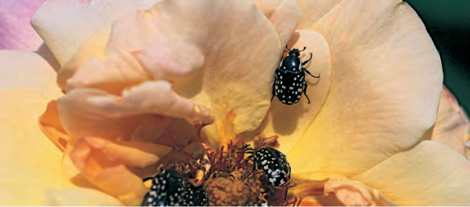
Жуки на розе в селе Сувелан. На Южном Кавказе ценность опыления пастбищ и кормовых культур может быть сравнима с ценностью возделываемых культур. Стоимость услуг по опылению по всему миру оценивается в 153 млрд. евро в год

Организации Объединенных Наций по окружающей среде (ЮНЕП) и координируемый FAO, позволит изучить и испытать в комплексных агроэкосистемах и различных природных условиях методы, которые помогут предотвратить утрату услуг по опылению, обеспечиваемых местными дикими опылителями. Региональные инициативы в других областях, в том числе в Европе, Северной Америке и Океании, имеют сходные цели. В рамках поддерживаемой стратегии необходимо проработать большую часть решений, направленных на то, чтобы сделать современное сельское хозяйство более благоприятным для биоразнообразия. Однако донести идею о ценности опылителей до тех, кто принимает соответствующие решения, – непростая задача. Опылителями в подавляющем большинстве случаев являются насекомые, а их считают скорее неприятными, нежели полезными.