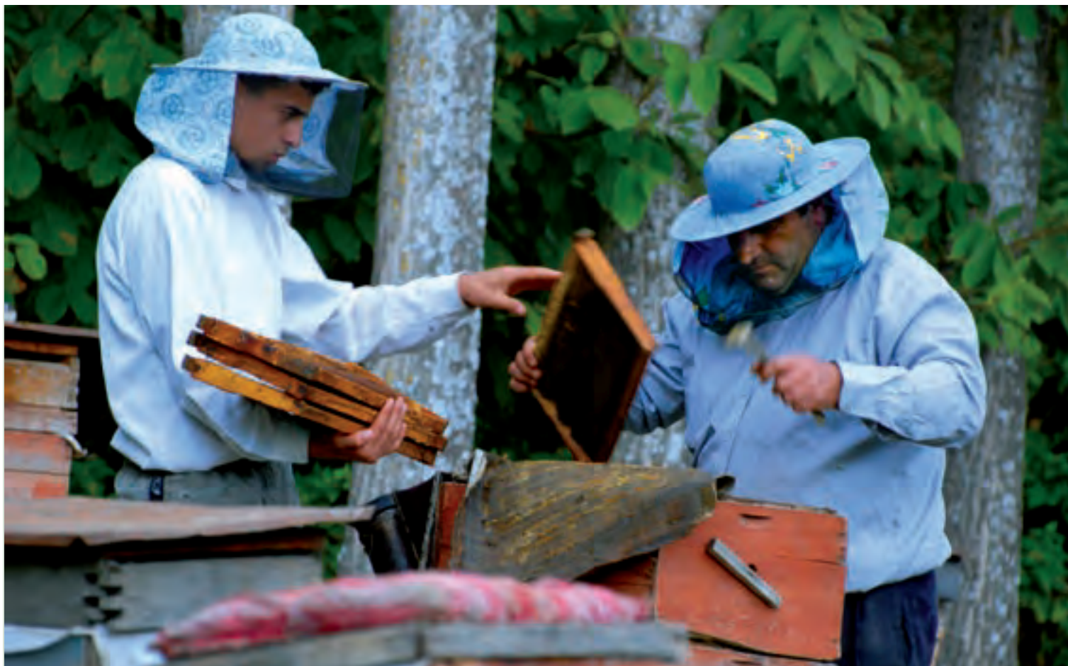
Пчеловодство – важный источник дохода. На фотографии: пчеловоды из села Енийол готовят ульи к зиме