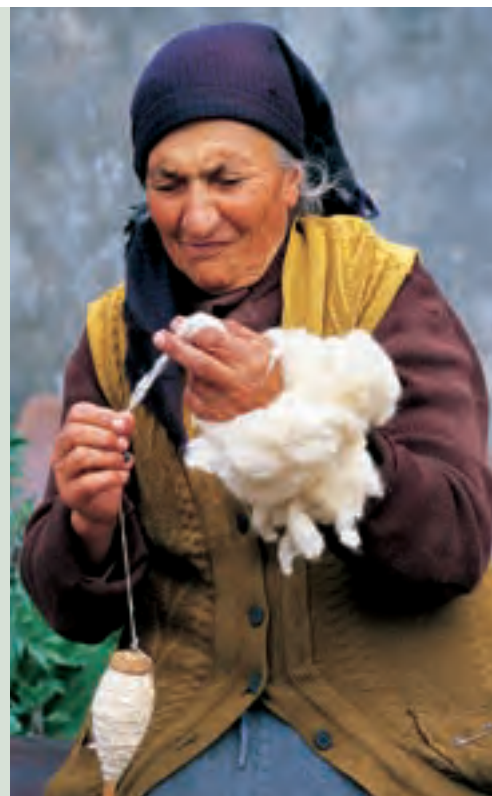
Различные этапы производства ковра: шерсть моют, вычесывают, прядут и, наконец, ткут ковры. Это преимущественно женская работа