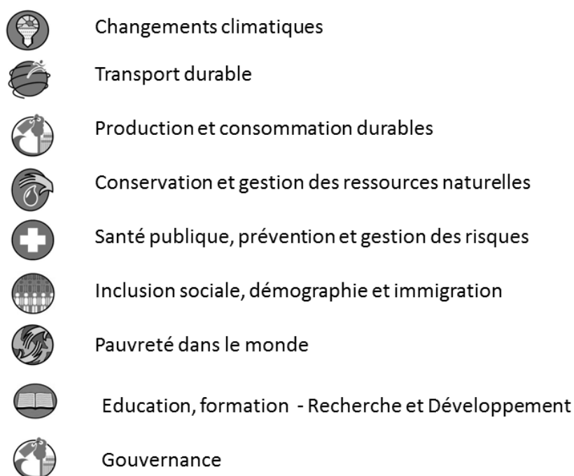
FIGURE 1 DES ATTENTES NOUVELLES (GROUDEL, 2013)

La CSV (Creating Shared Value) va au-delà de la CSR ou bien encore de la philanthropie. Elle se doit de correspondre parfaitement au cœur de métier de l'entreprise afin de créer du profit. La recherche d'impacts positifs peut s'exprimer, par exemple, par une meilleure gestion de l'eau, de l'énergie ou encore par une meilleure prise en considération des communautés rurales, dans le cas, par exemple, de projets d'aménagement. Il est évident que lorsque l'on a à traiter des problématiques forestières que les attentes des parties prenantes sont nombreuses (figure 1.).