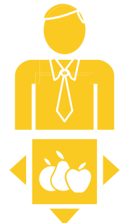
5. Wafanyabiashara wa kimataifa.