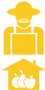
2. Wapambanaji wa kawaida