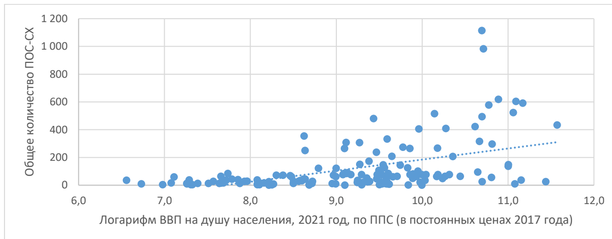
Рисунок 3. Взаимосвязь между общим количеством ПОС-СХ в РТС страны и ВВП на душу населения