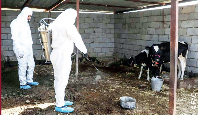
دوا پاشی طویله غرض از بین بردن حامل بیماری کانگو