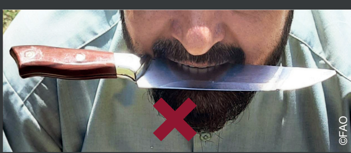
گرفتن کارد یا چاقو در دهن