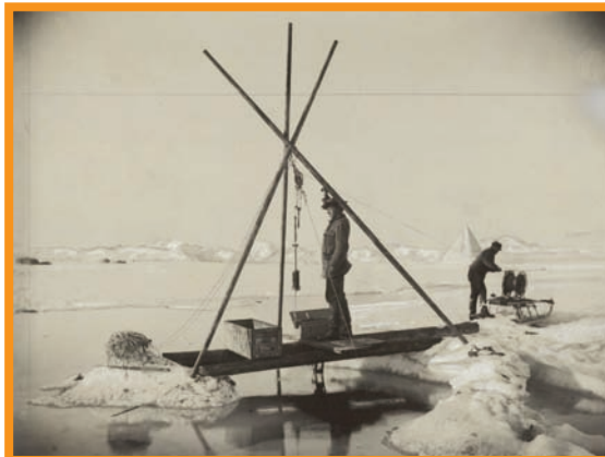
Dr Fridtjof Nansen sampling deep Arctic Ocean water during an expedition