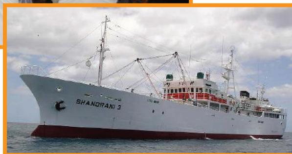
Picture of a typical Mauritian Banks Fishing Vessel Photo d'un navire de pêche typique mauricien