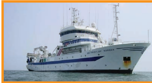
Research Vessel Dr Fridtjof Nansen Navire de Recherche Dr. Fridtjof Nansen

On 20 th October 2011 the Northwest Africa Ecosystem survey by the R/V Dr Fridtjof Nansen took off from Conakry, Guinea. The survey on the continental shelf of the countries in Northwest Africa lasted for 62 days and 32 scientists and technicians from 8 countries participated in it. It is the first comprehensive ecosystem survey in the entire CCLME region by the R/V Dr Fridtjof Nansen . The survey was carried out as a partnership between the EAF-Nansen Project and the Canary Current Large Marine Ecosystem (CCLME) project. Progress of the survey, preliminary findings, and interesting pictures were provided in weekly diaries released from the vessel. The cruise log is still available from http://www.imr.no/forskning/bistandsarbeid/surveys/northwest_africa/en .