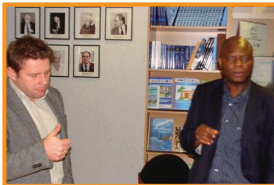
IOC colleagues after the seminar Collègues du CIO après le séminaire