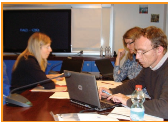
EAF Course review meeting participants at work Participants à la réunion pour la révision du cours sur l'AEP, au travail

A review meeting on the FAO university course on ecosystem approach to fisheries (EAF Course) was held at FAO, Rome on 10 and 11 November 2011. The meeting was attended by all FAO staff who had contributed to the teaching of the course and representatives from two of the universities that have hosted the course, namely Rhodes University, South Africa and Université Ibn Zohr, Morocco. The objectives of the meeting were to analyse the courses held, improve the structure and content of the course, and review the materials and presentations for the course. The meeting agreed that it will be important to prepare case studies of one or two real examples to be presented to students. It was also noted that since good EAF management plans are not easy to find this could be a good opportunity to prepare a format for such a plan. However, some participants expressed their concerns regarding providing a format, highlighting the risk of people giving more importance to a final product instead of a process.