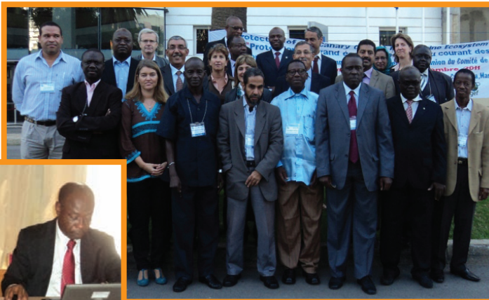
Group photo of CCLME Steering Committee participants

Nansen est un partenaire essentiel, en particulier pour l'exécution des activités liées à l'AEP. Le