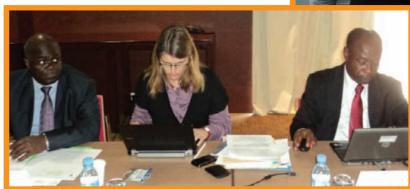
FAO team at the CCLME Steering Committee Meeting Équipe de la FAO à la réunion du Comité Directeur du projet CCLME

The Second Steering Committee meeting of the Canary Current Large Marine Ecosystem (CCLME) project was held on 28 and 29 November 2011 in Casablanca, Morocco. FAO is the lead GEF agency of the project of which the EAF-Nansen project is a key partner, particularly for the execution of the EAF-related activities. The Coordinator of the EAF-Nansen project made a presentation