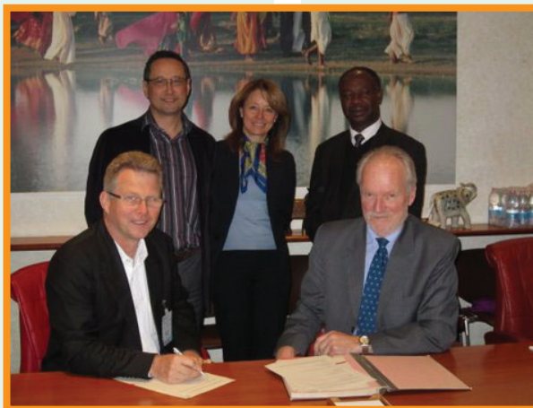
The agreement for the transition phase being signed in Rome L'accord pour la phase de transition lors de la signature à Rome

On 1 January 2012, the EAF-Nansen project went into a new three-year transition phase. From the project's achievement since its inception, one would expect a move to a full second phase. It has been suggested that future phases of the EAF-Nansen project should also take in board issues related to climate change and effect on marine ecosystems, the distribution and abundance of marine species and fish communities as well as the capacity of fisheries administrations in the project countries to implement fisheries management plans. This is an extremely important move to ensure that developing countries are not left out of activities involving effects of climate change and related adaptation and coping strategies. The transition phase is being used to look at how the above issues can be adequately addressed in the future project. Also the options for the component of the project requiring the use of a research vessel are being analysed. An assessment of the present R/V Dr Fridtjof Nansen which is about 18 years old, indicated that the vessel is not adequately equipped to handle the new tasks effectively. There have been discussions about its replacement but no concrete decision has been taken yet by the donor, the Norwegian Ministry of Foreign Affairs. The transition phase started with