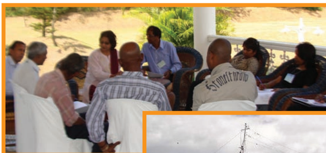
Issue identification session in Mauritius Une session sur l'identification des enjeux à l'île Maurice

Late last year the EAF-Nansen Project Coordinator (Coordinator) and the Regional Executive Secretary (RES) of the South West Indian Ocean Fisheries Project (SWIOFP) entered into a strategic partnership to put their efforts together to start new national EAF projects in Kenya, Mauritius, Madagascar and Comores. SWIOFP also agreed to "invest" in the projects in Mozambique, Seychelles and Tanzania. In January 2012, the Coordinator and RES undertook joint missions to roll out the projects.