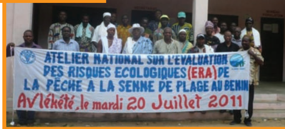
Participants of the ERA validation workshop in Cotonou, Benin Participants of l'atelier de validation d'ERA au Bénin