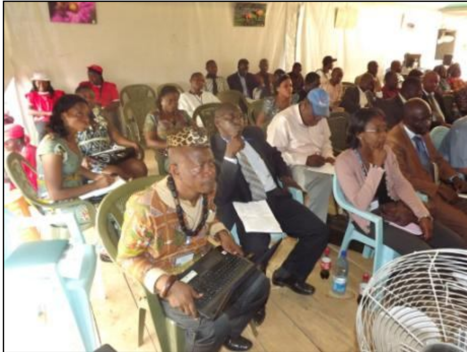
Photo 1. Assistance attentive à un exposé

Un panel représentatif de tous les acteurs du secteur des PFNL a participé à la conférence débat.