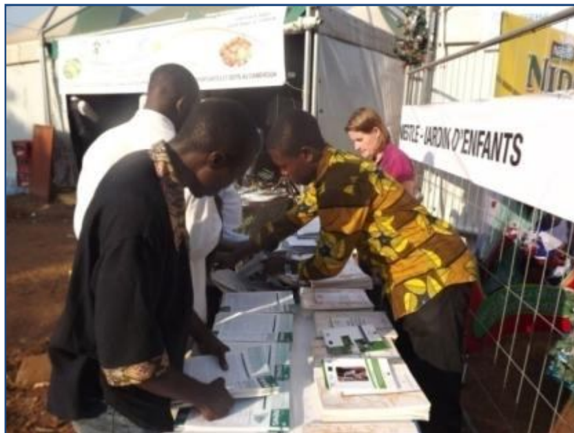
Photo 5. Exposition et distribution des documents

Un stand a été monté pour l'exposition et la distribution gratuite de documents (copies dures et numériques) produits par la FAO dont la liste figure en annexe. Ce stand a aussi permis d'échanger avec le public, qui n'a pas pris part au débat en répondant à des questions relatives aux PFNL.