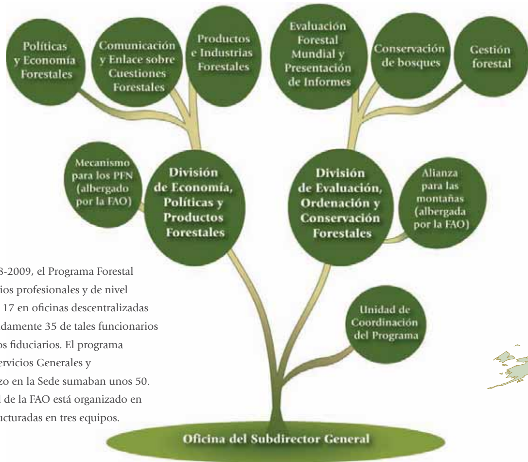
Estructura del Departamento Forestal en la Sede de la FAO