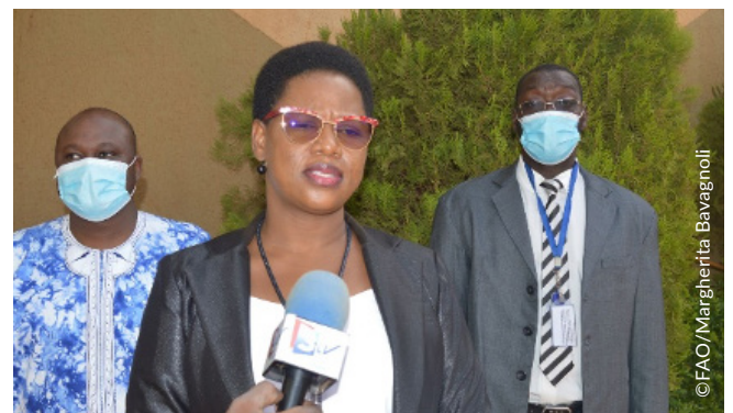
Illustration 1 Huguette Bama, directrice générale de l'Agence Burkinabè des investissements, interviewée sur une chaîne nationale à l'issue de l'atelier

L'évènement a aussi permis de présenter et valider la première étude élaborée avec le projet au Burkina Faso: cette analyse d'économie politique des systèmes alimentaires burkinabè ("Political economy analysis of the Burkinabè food systems") a été menée en partenariat avec le Centre européen de gestion des politiques de développement (ECDPM). L'étude suggère le riz et l' aquaculture comme chaînes de valeurs prioritaires, compte tenu de leur potentiel en matière de résultats socio-