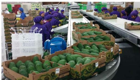
Palta Hass peruana cada vez en más:

Durante el 2014, las exportaciones de palta Hass alcanzaron las 164,714.00 Tm generando ingresos de más de US$ 280 millones, incrementándose en un 56.70% en comparación al año 2013.