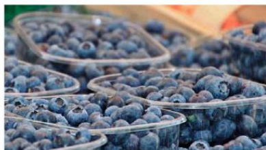
Los arándanos peruanos conquistan los paladares:

MINAGRI abre mercados para más productos vegetales