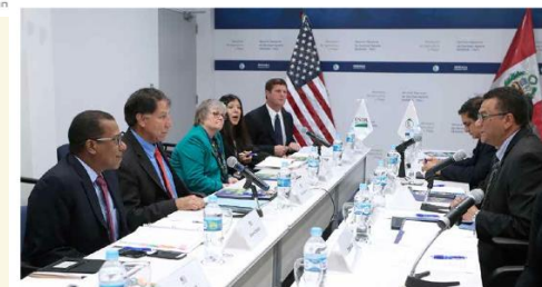
Reunión técnica entre MINAGRI, SENASA y el Departamento de Agricultura de EE.UU.

Agresiva política exportadora del MINAGRI y calidad técnica del SENASA, facilitan acuerdos fitosanitarios para que consumidores de EE.UU. y Corea del Sur accedan a productos agropecuarios peruanos.