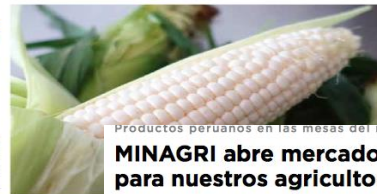
El maíz fresco, un

Con el acceso del maíz fresco a Chile, no se necesitará congelar los granos para exportar ya que ahora se puede enviar la mazorca completa.